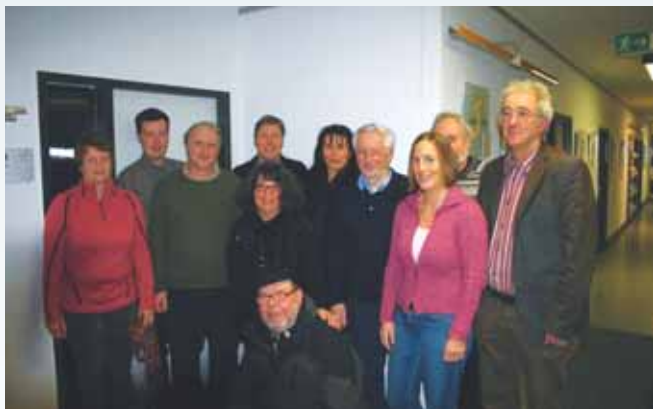
Vorstand und Bezirksbeiräte SPD Birkach / Plieningen