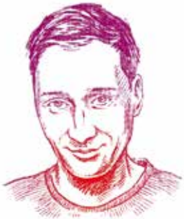
PAUL VAN DYK DJ, Musikproduzent

Kulturelle Teilhabe: Kulturpolitik der SPD ist nicht paternalistisch und elitär, sondern nimmt alle Menschen mit ihren kulturellen Bedürfnissen, Erfahrungen und Potenzialen in den Blick. Gegen neue soziale Ungleichheit, zunehmende Ausgrenzung und Spaltung unserer Gesellschaft geht es darum, Zugänge zu Kunst und Kultur für alle zu eröffnen. Das schließt den Blick auf die Gleichstellung der Geschlechter, auf die besonderen Bedürfnisse von Migrant*innen, Jugendlichen und Älteren, Menschen mit Behinderungen sowie auf die kulturellen Spaltungen in der Mediennutzung mit ein. Teilhabe ist nicht mehr nur eine sozialpolitische, sondern gleichermaßen eine kulturelle (und bildungspolitische) Aufgabe. „Die Politikerinnen und Politiker der SPD wollen, dass alle Menschen überall mitmachen können. Sie wollen Kultur für alle.“ – diese Sätze in dem Bundestagsantrag in „Leichter Sprache“ verdeutlichen unseren politischen Anspruch.