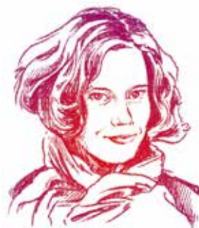
EVA MENASSE Schriftstellerin

Kreativität ist der Rohstoff des 21. Jahrhunderts mit immensen Wachstums- und Beschäftigungspotenzialen. Wir werden zusammen mit Kreativen die Rahmenbedingungen schaffen, um diese Potenziale zu entfalten und gleichzeitig sozial besser abzusichern.