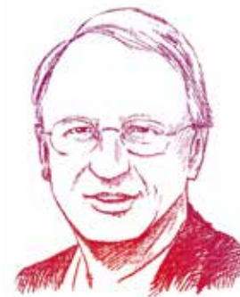
KLAUS STAECK Plakatkünstler, Graphiker

„Die Kultur ist nicht die Petersilie auf der kalten Platte der Gesellschaft, sondern unverzichtbar für ein gedeihliches Zusammenleben. Künstler ticken anders. Das sollte man nutzen. Für eine produktive Reibung und Partnerschaft zwischen Kunst und Politik!“