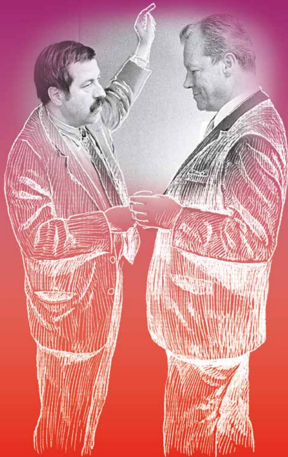
INGO SCHULZE Schriftsteller

„Ich wünsche mir von der SPD, dass sie sich vernehmlich zum demokratischen Sozialismus bekennt.“