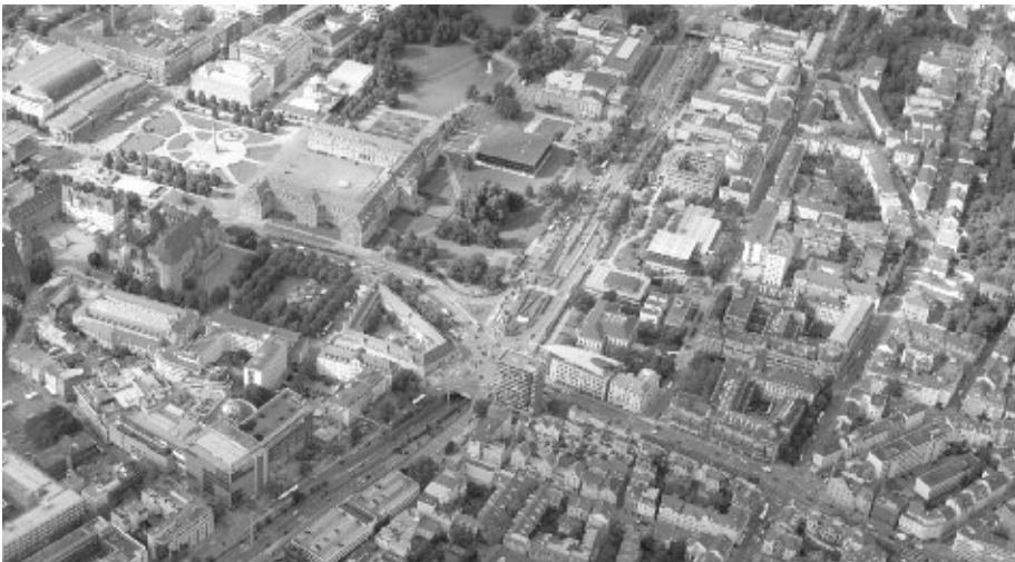
Blick auf Schlossplatz und Charlottenplatz.

Diese Projekte bergen Chancen und Risiken für unsere Stadt. Das Interesse internationaler Investoren ist ein Zeichen für die wirtschaftliche Stärke der Region. Durch die Erneuerung der Infrastruktur besteht die Chance, einer der attraktivsten Wirtschaftsstandorte der Welt zu bleiben. Es können neue Arbeitsplätze entstehen, jedoch sollte die Lebensqualität hierunter nicht leiden. Im Idealfall werden die Projekte genutzt, um unseren Stadtbezirk auch im Interesse der Anwohner zu gestalten.